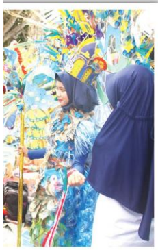
satu peserta Lomba Cipta Kreasi ng.

resna berpendapat, kegiatan g Beach Festival yang ke dua ini sebagai langkah kongkrit dari aten Malang untuk menunjang remaksimalisasi potensi yang Kabupaten Malang, khususnya sektor pariwisata.