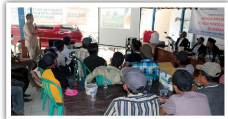
Edukasi pembuatan digester biogas. (rhd)

pa pembenahan instalasi PLTMH dan jaringannya, serta membangun unit digester biogas yang dapat meningkatkan kapasitas ketersediaan energi mandiri yang sangat dibutuhkan masyarakat dalam upaya menggerakkan aktifitas ekonomi, pendidikan, energi dan penataan lingkungan, sehingga mampu membawa kehidupan masyarakat Tanah Merah yang lebih sejahtera. Rencana luaran yang ditargetkan, yaitu meningkatnya kapasitas PLTMH, dibangunnya unit digester biogas, transfer of technology pembuatan digester biogas secara mandiri oleh masyarakat dan pemeliharaan digester, diperbaikinya sistem jaringan PLTMH dan dimulainya aktifitas