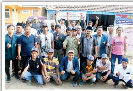
Warga desa Batur bersama tim Doktor Mengabdi Universitas Brawijaya. (rhd)

■ Perbaiki PLTMH dan Bangun Digester Biogas