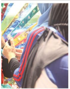
kan kostum berbahan daur ulang

am agenda Malang Beach Festi-ri ini ada beberapa festival dan di dalamnya. Itu juga adalah atu upaya untuk meningkatkan si yang kita miliki di Kabupat-ulang terutama dalam sektor isata," ujar Rendra. (kik/jun)