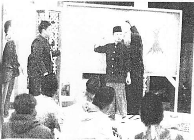
Lampiran 6 Foto kegiatan, gambar, tabel, atau data pendukung lain yang relevan