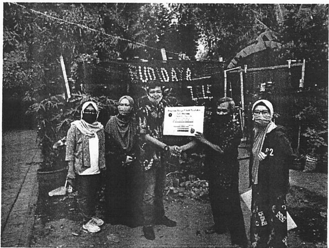
Gambar 8 Foto Serah Terima Aplikasi HPP kepada Pemilik