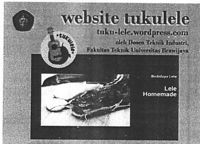
Gambar 3 Gambaran Website TukuLele

Fakultas Teknik, Universitas Brawijaya beserta pemilik usaha lele organik, UMKM Mina Barokah kelurahan Balaerjosari, Kota Malang.