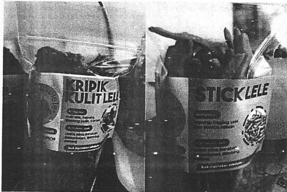
Gambar 4 Produk Olahan Lele Organik berupa Kripik Kulit Lele dan Stick Lele