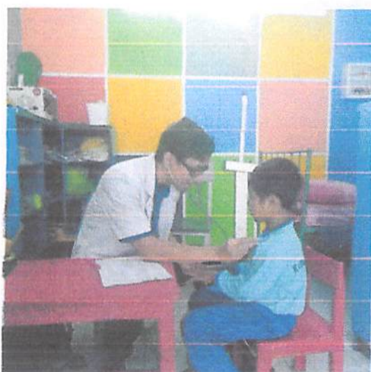
Gambar 2 Pemeriksaan kesehatan siswa TK ABA 23 di Desa Kucur