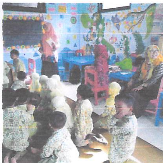
Gambar 1 Pemeriksaan kesehatan siswa TK ABA 23 di Desa Princi