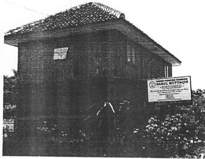
Gambar 1. Bangunan Pondok

melibatkan melibatkan sebagian anggota masyarakat, selain aktivitas bimbingan rohani yang dilakukan oleh pihak pondok.