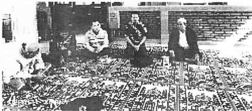
Kunjungan Survey Tim Ke Pondok