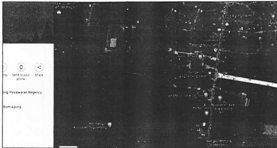
Gambar 4. 21 Lokasi Kawasan Pendidikan SMP IT Nurul Hidayah

Yayasan ini memiliki lahan dengan luas 30.000 m 2 , yang akan dikembangkan untuk sarana pendidikan SMP, Musholla, PAUD dan TPA. Selain itu lahan lainnya akan dikembangkan sebagai usaha produktif dengan harapan dapat dimanfaatkan untuk pengembangan sekolah ke depannya. Saat ini, yayasan ini membawahi Pendidikan formal SMP IT Nurul Hidayah dan pendidikan non formal yaitu PAUD dan TPA Nurul Hidayah serta rencana rumah tahfidz atau menghafal ayat suci Al-Qur'an untuk anak-anak.