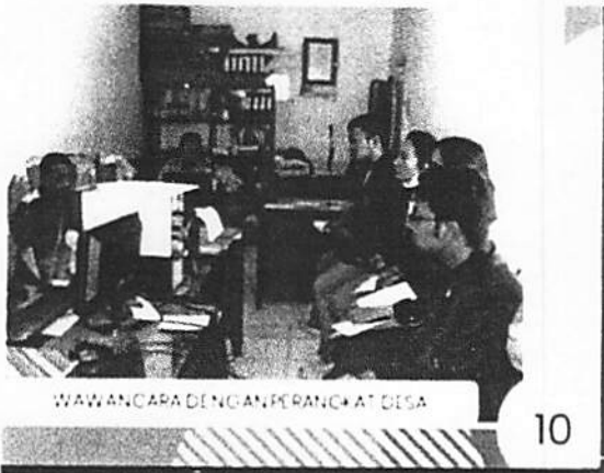
Koordinasi awal dengan Aparat Desa untuk pelaksanaan PKM untuk