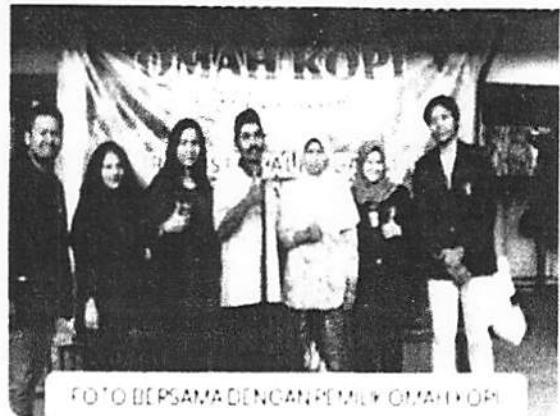
Pendataan Awal Potensi Perkebunan dan pengolahan Hasil Kebun Kopi menjadi produk wisata