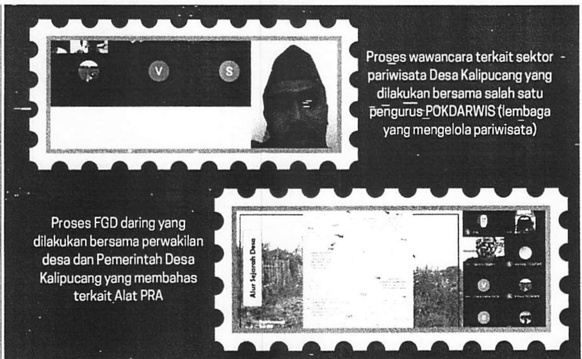
Proses Pendataan Potensi Desa dan Penelusuran Potensi masalah dengan Sistem Daring melalui zoom