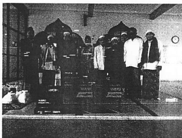
Penyerahan Sarana Prasarana Penunjang Adminstrasi bagi Pengurus dan Remaja Masjid Besar Darul Muhtadin