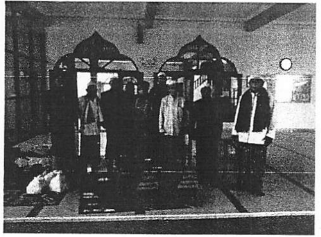
Penyerahan Sarana Prasarana Penunjang Adminstrasi bagi Pengurus dan Remaja Masjid Besar Darul Muhtadin