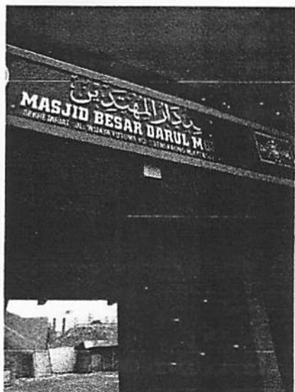
Lokasi Masjid Besar Darul Muhtadin Desa Mulyoagung, Kecamatan Dau Kabupaten Malang