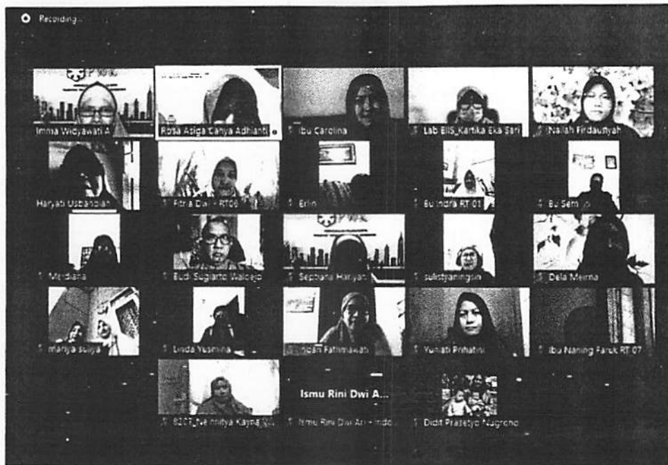
Gambar 4.3. Peserta Sosialisasi Pembuatan Sabun dari Minyak Jelantah