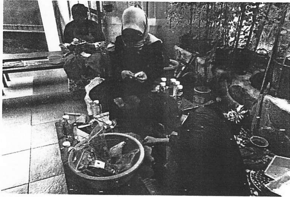
Gambar 13. Persiapan bahan-bahan