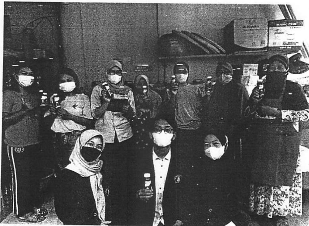
Gambar 14. Foto setelah pelatihan bersama produk minuman yang dihasilkan