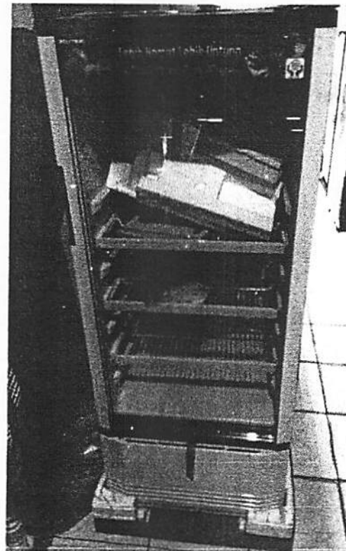
Gambar 15. Serah terima show case display minuman