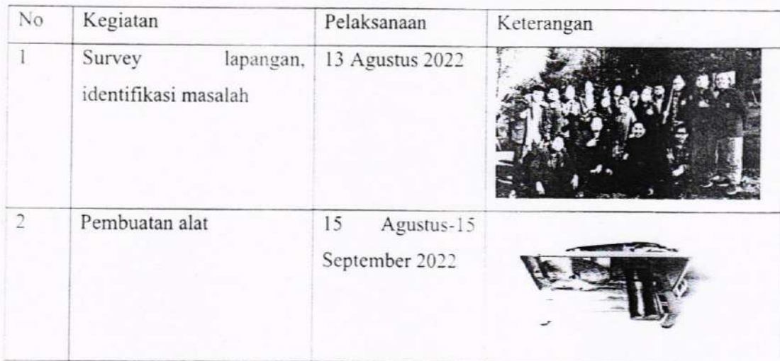
Tabel 4.1 Kegiatan yang dilakukan

Pelaksanaan yang sudah dilakukan dapat dilihat pada tabel 4.1