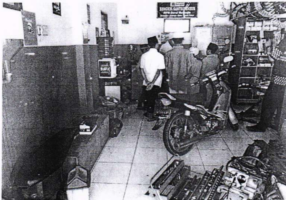
Foto santri saat pengenalan alat bengkel