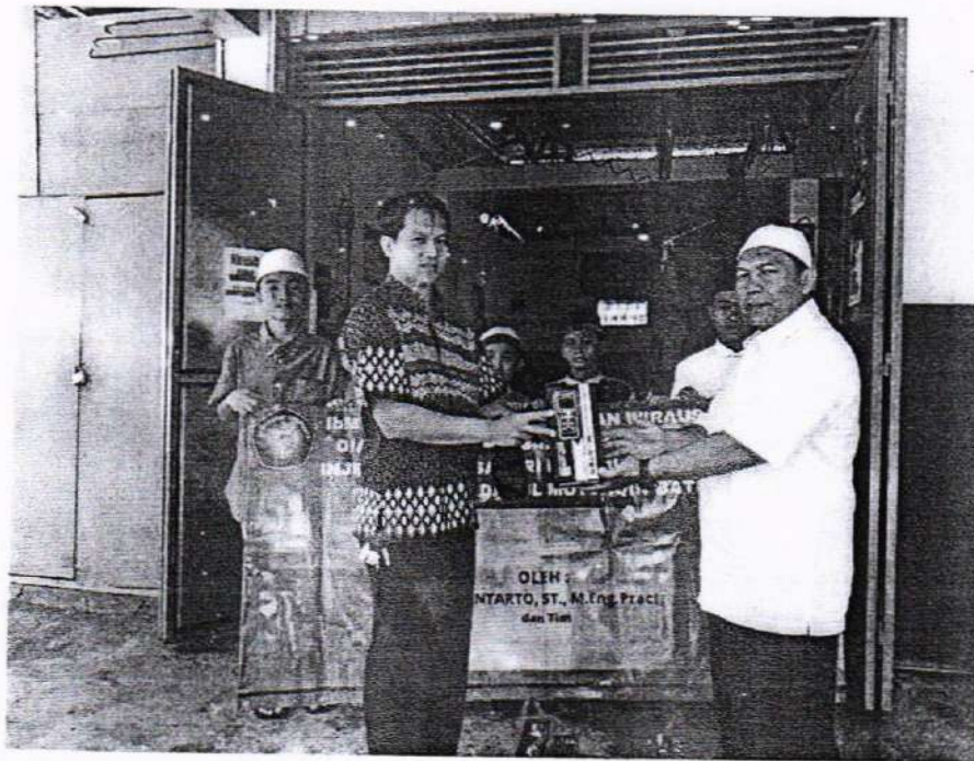
Penyerahan Alat Scan Tool ke pengurus Pondok Darul Muttaqin Batu