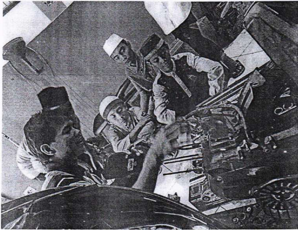
Foto santri saat pengenalan mesin sepeda motor di bengkel