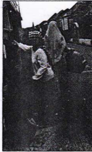
Gambar 4. 5 Disribusi Tong Sampah pada Warga